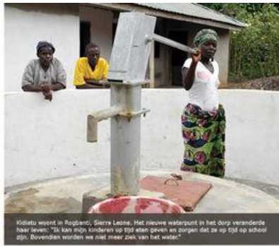
Kulieta woont in Rogbandi, Sierra Leone. Het nieuwe waterpunt in het dorp veranderde haar leven: "Ik kan mijn kinderen op tijd eten geven en zorgen dat ze op tijd op school zijn. Bovendien worden we niet meer ziek van het water."